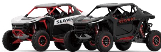
Super Villain SX20T Hybrid