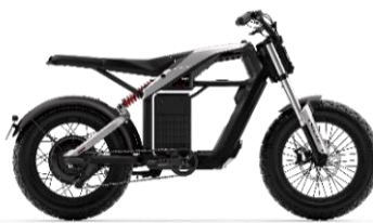
Segway E-bike Xyber