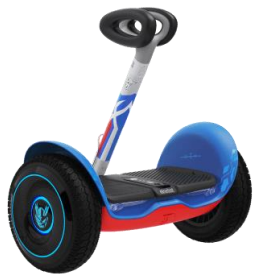
电动平衡车 L8 奥特曼版

在共享商用出行领域，公司的多款产品已成为全球主要微出行运营商和用户的首选。2023 年，公司推出了旗舰版共享滑板车 Apex D110 等多款共享产品。Apex D110 是基于九号经典共享电动滑板车 Ninebot Max 系列的升级平台产品，在运营效率、产品安全、用户骑行体验、产品寿命等多个方面进行了全面升级，致力于在全球共享微出行行业树立新的共享滑板车产品标杆。产品通过以全生命周期总拥有成本（TCO）为导向，旨在成为全行业最优的硬件车型，为共享运营商客户提升运营效率并实现盈利，提供最佳的硬件车辆方案。