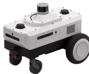
Nova Cater AMR