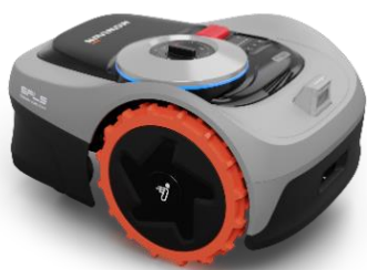
Navimow i 系列

位技术，定位更准确，稳定性更强，为智能割草机器人走进更多全球家庭铺平道路，致力为千万用户带来更加美好的割草体验。