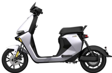
九号电自 MMAX 系列

电摩 E300P 搭载国内首发的 HIAS 系统，自行计算并修正灯光的铺路范围，保证夜晚安全视野；搭载 RideyFUN 系统，通过全新交互实现导航、音乐、通话等功能；实现极速 135km/h、百公里加速 7.9s，搭载自研前后双通道 ABS 及 TCS 技术，实现性能与安全兼顾。远行家 M95C，搭载自研的 RideyLONG 长续航系统，实现续航能力 25% 的提升，五级可调的舒适减震以及前后碟刹的安全配置，满足大多数人的出行需求。此外，为了丰富不同人群的出行场景需求，还发布了小巧轻便、满足简单出行的 V30C；舒适安全、轻松操控的 Q 系列；智能性能均旗舰的 MMAX110；续航配置全面升级的全面选手 F90M 等，让越来越多的人成为九号的用户，电动两轮车 300 万台出货纪录的背后，源自 300 万用户的选择，也是 300 万个家庭的信赖。