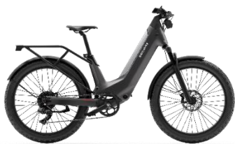
Segway E-bike Xafari

在共享商用出行领域，公司推出共享 E-bike B100 等系列产品。E-bike B100 是一款轻量化的共享电动自行车产品，针对共享市场上自行车成本高、操控感不流畅的特点而设计。该产品采用轻量、稳定和舒适的设计，以满足城市通勤者的需求。E-bike B100 致力于为用户提供流畅舒适的骑行体验，同时优先考虑道路安全和运营效率，提供高性价比的硬件产品，以满足运营商的需求。