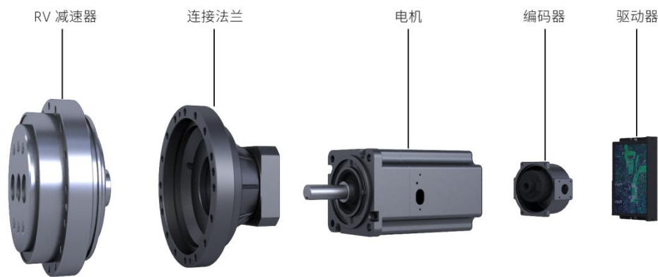
图一、智能执行单元图示（以 RV 一体机为例）