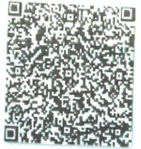
徐小哲的年检二维码.png

本证书经检验合格 This certificate is valid this renewal.