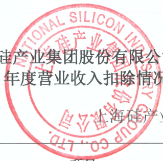
上海硅产业集团 2023 年度营业收入扣除情况表