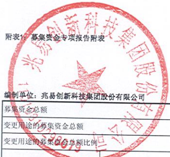
附表1：募集资金专项报告附表