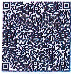
智能防伪年检二维码

年度检验登记 Annual Renewal Registration 证书经检验合格，继续有效一年。 This certificate is valid for another year after this renewal.