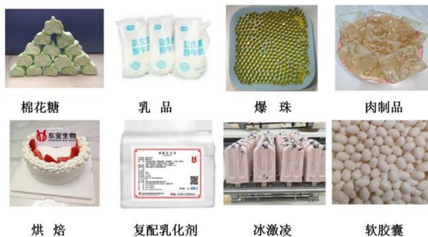
图 2 明胶/空心胶囊部分应用示例

明胶广泛应用于糖果(包含软糖)、乳品、爆珠、复配乳化剂、肉制品、烘焙、复配乳化剂、饮料、冰激凌、软胶囊等保健品/营养健康食品领域(详见图 2); 空心胶囊广泛应用于保健品等领域; 胶原蛋白广泛应用于功能食品、保健食品(口服液、固体饮料等)、宠物营养食品(湿粮罐头)、医美生美(药膏剂型、化妆品)(详见图 3、图 4), 以及能源、纺织等工业应用领域。