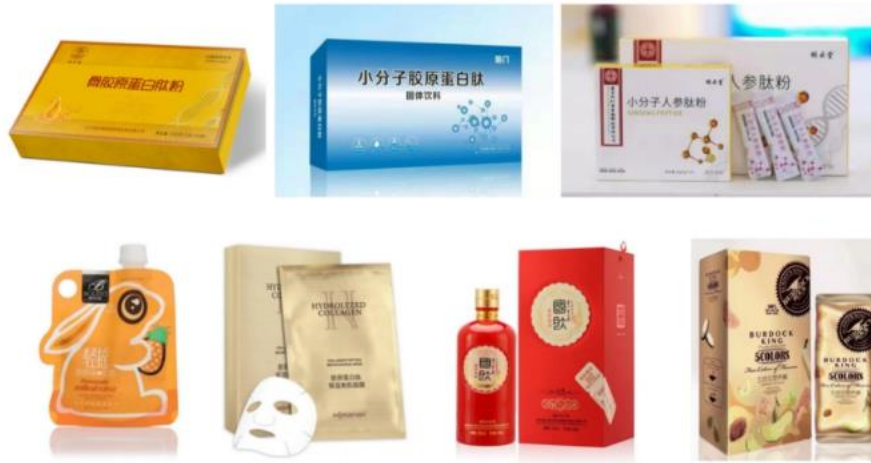
图 3 胶原蛋白部分应用示例