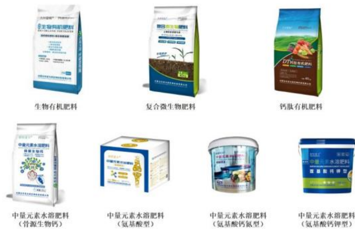
图 5 肥料类产品示例

大田公司的肥料类产品具有富含“活性钙”和“小分子肽”的独特优势，能够更好地满足农作物生产所需的营养需求，可广泛适用于大棚温室、有机农业、大田生产等，具有改良土壤和提高作物产量品质等肥效(详见图 5)。