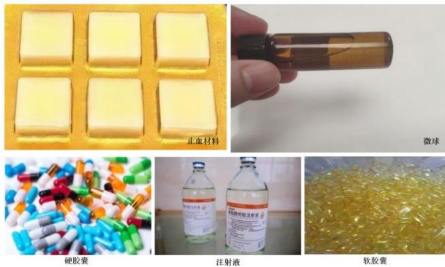
图 1 明胶/胶囊/代血浆明胶部分应用示例

明胶注射液的生产，同时也可广泛应用于止血材料、凝胶剂、微针、微球等领域(详见图 1)。