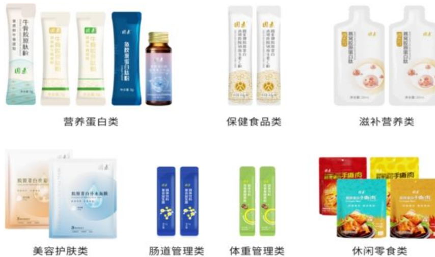
图 4 终端系列产品示例