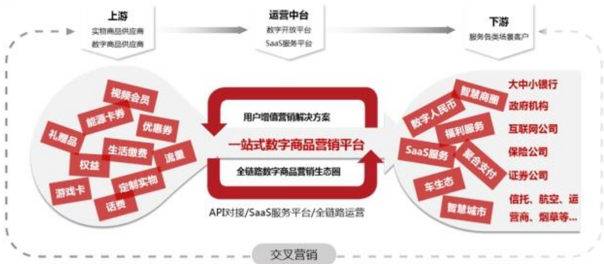
图一：数字生活营销业务基本模式

以一站式数字生活营销解决方案为核心产品，聚合数字化产业上下游资源，打造数字化营销服务中台，通过专业级的数字商品分发引擎和营销活动引擎，构建数字生活营销生态体系，实现用户价值的深度挖掘和持续增长。公司与中国银联、五大国有银行、大中型股份制银行，平安保险、中国人保、太平洋保险等保险公司，以及各类基金、券商、信托等非银金融保持持续稳定合作；同时，公司也是微信、支付宝等大型互联网平台的优质服务商，为客户提供用户生命周期运营管理服务，在泛金融领域长期居于头部服务商地位。