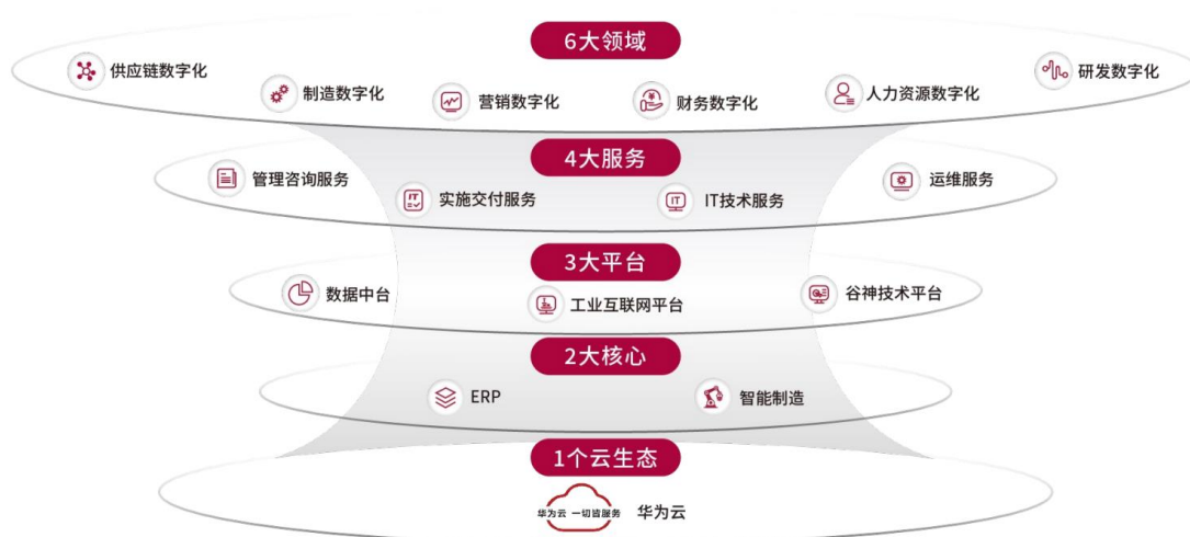
赛意信息企业数字化服务体系