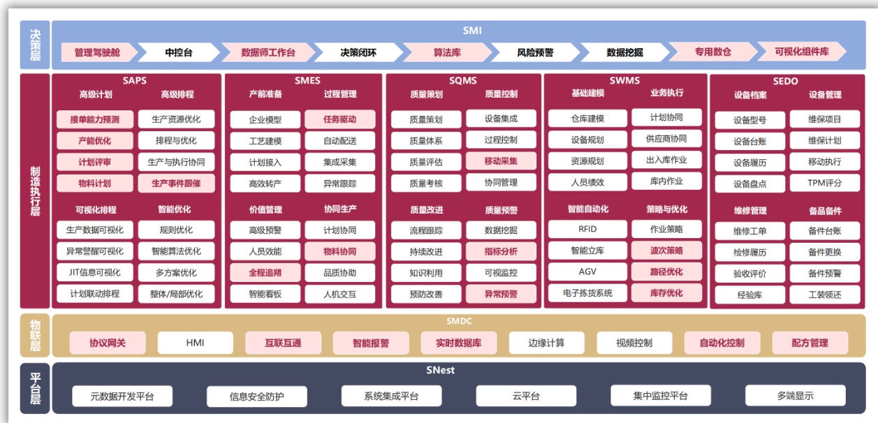
赛意信息 SMOM 智能制造产品家族概览

工业互联网是新一代网络信息技术与工业系统全方位深度融合所形成的技术体系和产业生态。作为实现产业数字化、网络化、智能化发展的重要基础设施，工业互联网通过人、机、物的全面互联，推动形成全新的工业生产制造和服务体系，成为工业经济转型升级的重要途径。