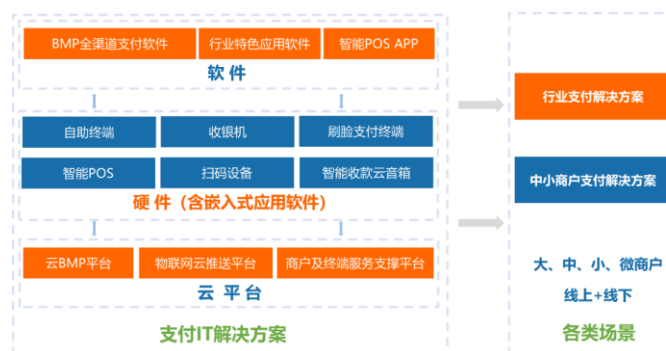
图：商户端支付解决方案

按照服务模式不同，商户规模大小，方案的个性化程度，技术实现难易程度，商户端支付解决方案分为行业支付解决方案及中小商户支付解决方案。