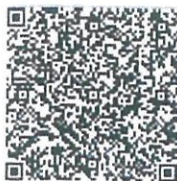
赫丽江的年检二维码.png