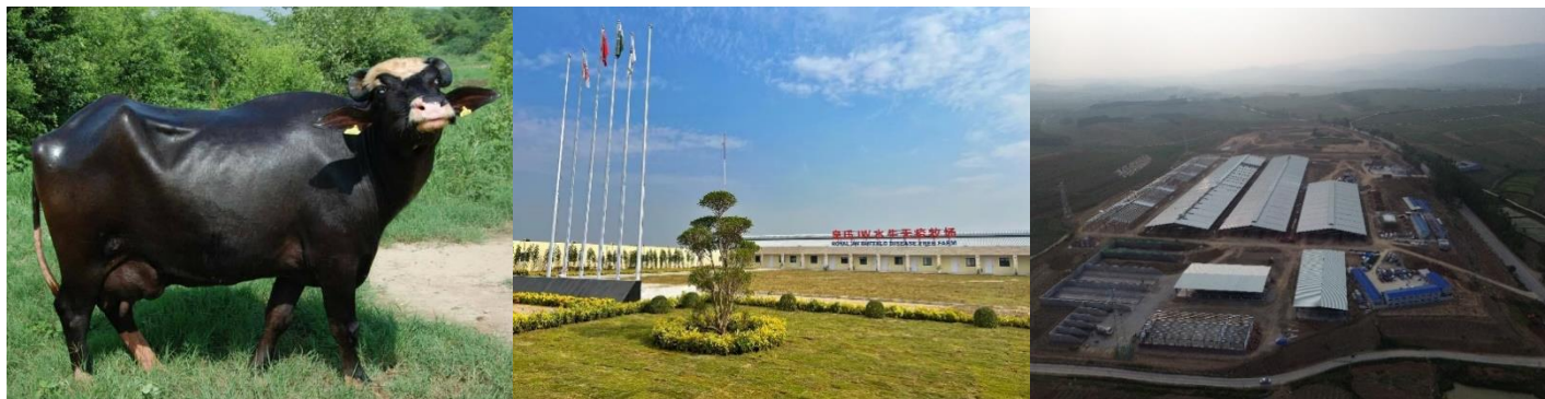
公司尼利拉菲水牛 位于巴基斯坦的皇氏 JW 水牛无疫牧场 上思万头奶水牛种源扩繁基地（在建）