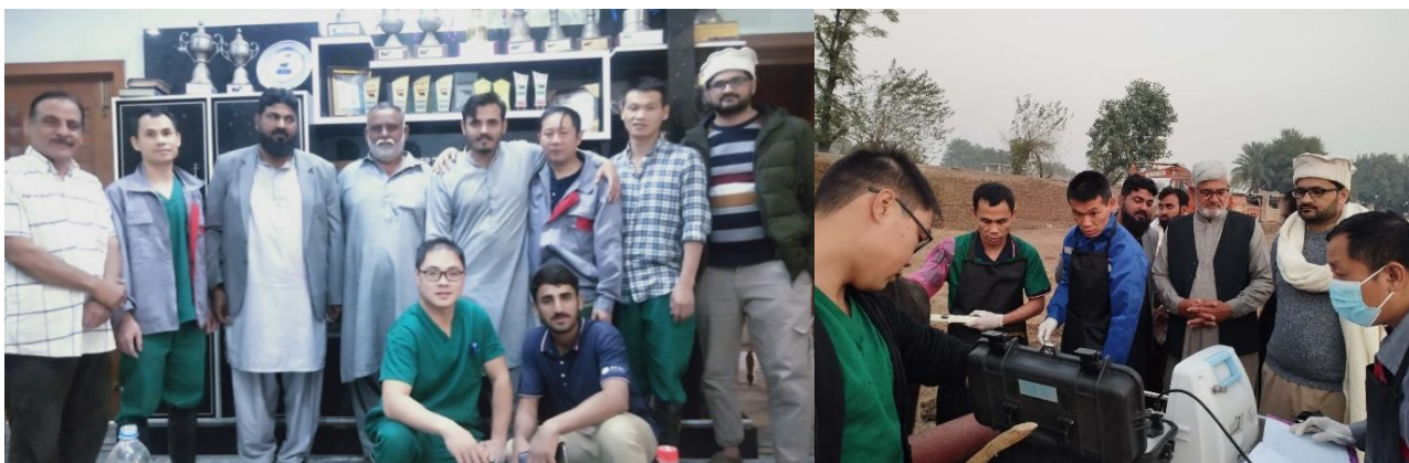
公司技术团队培训巴基斯坦配种公司

1、在水牛育种方面，公司在巴基斯坦拉合尔、费萨拉巴德等市的数十个村庄和牧场提供无偿帮助，通过活体采卵和胚胎生产移植帮助当地农民快速获取和繁衍高产奶水牛，大大提高了优质种源的繁衍速度，同时成功地延续了一头 20 岁高龄冠军产奶水牛的优良种源，更是在巴基斯坦畜牧业引起了广泛关注。公司将生产的水牛胚胎无偿赠送给巴基斯坦科研机构、企业或者农户使用。截止 2023 年，公司已经向当地赠送水牛胚胎 1500 多枚，用于科学研究和胚胎移植试验，价值 500 多万元。