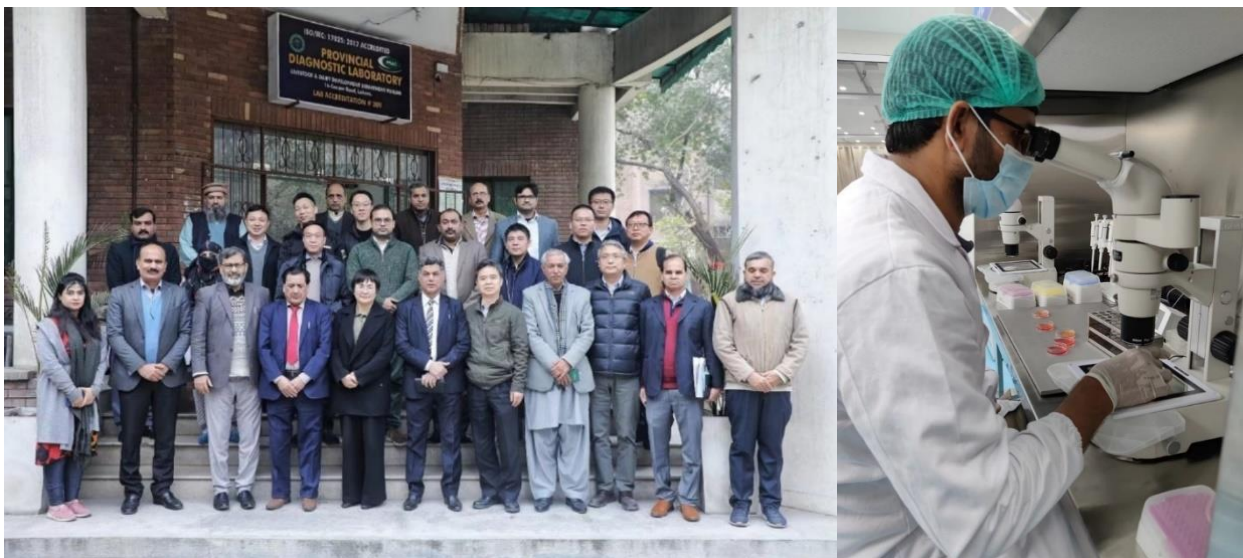
海关总署、农业农村部专家组赴巴基斯坦现场验收

公司位于巴基斯坦旁遮普省的水牛无疫牧场成为巴基斯坦首个、同时也是全球唯一可以向中国出口高产水牛胚胎的牧场，胚胎引进回国后将为我国源源不断的繁育出高产奶水牛群，在短时间内使中国拥有大批量的高产奶水牛，推动中国奶水牛平均产奶量快速提升。公司在水牛育种领域的技术已具备领先水平，建成水牛多样性基因库，获取了世界各地几十个品种数千头水牛的全基因组测序结果。为有效承接公司从巴基斯坦引入的优质种源，公司于上思、来宾、宾阳等地的万头牧场已相继开工建设，公司已经成为国内首家奶水牛育种并实现商业化运作的公司。