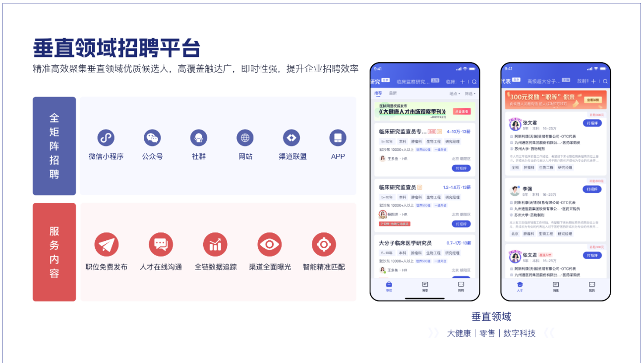
图 3：人力资源管理 SaaS 平台