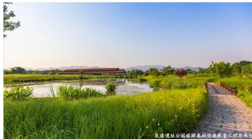
Hangzhou Landscape Architecture Design Institute Co., Ltd.