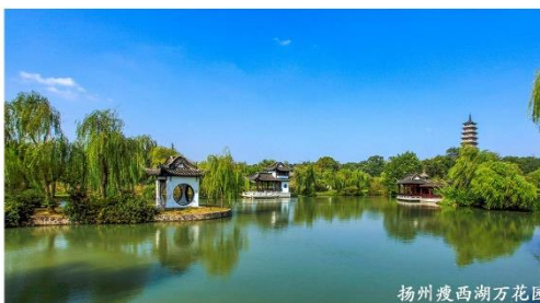
扬州瘦西湖万花园