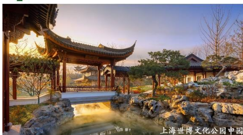
上海世博文化公园中国