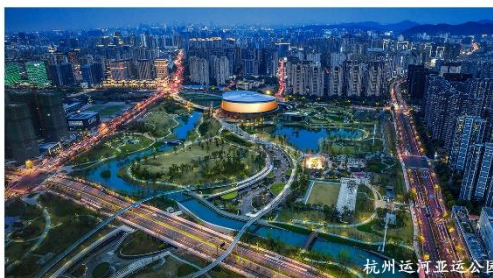
杭州运河亚运公园

Hangzhou Landscape Architecture Design Institute Co., Ltd.