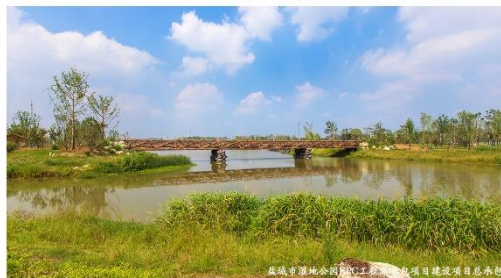
Hangzhou Landscape Architecture Design Institute Co., Ltd.