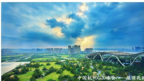
中国杭州G20峰会 屋顶花园

Hangzhou Landscape Architecture Design Institute Co., Ltd.