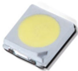
(4) 高光效 SMD 灯珠，光效范围从 170lm/w—230lm/w