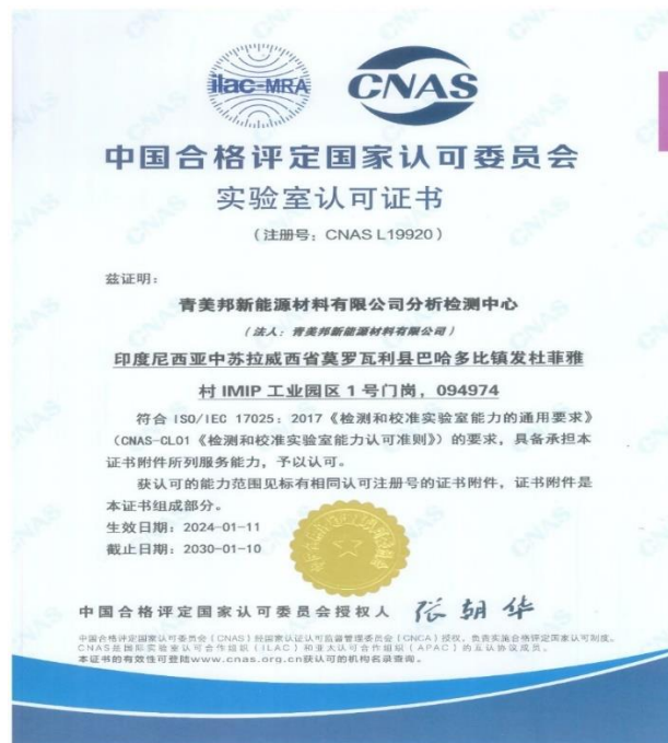
图 5 CNAS 实验室认可证书

2024 年 1 月 17 日，印尼青美邦分析检测中心喜获中国合格评定国家认可委员会（China National Accreditation Service for Conformity Assessment, CNAS）的认可资质，是印尼首家同时获得“红土镍矿+粗氢氧化镍+硫酸镍+水质”四项 CNAS 认证的实验室；同时，也是印尼最快获得 CNAS 国际认可实验室资格认证的实验室之一，从接受注册到通过认证仅历时 6 个月零 5 天。2024 年 1 月 17 日，印尼青美邦分析检测中心喜获中国合格评定国家认可委员会（China National Accreditation Service for Conformity Assessment, CNAS）的认可资质，是印尼首家同时获得“红土镍矿+粗氢氧化镍+硫酸镍+水质”四项 CNAS 认证的实验室；同时，也是印尼最快获得 CNAS 国际认可实验室资格认证的实验室之一，从接受注册到通过认证仅历时 6 个月零 5 天。