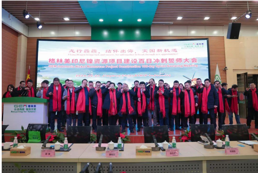
图 3 格林美印尼镍资源项目建设百日冲刺誓师大会