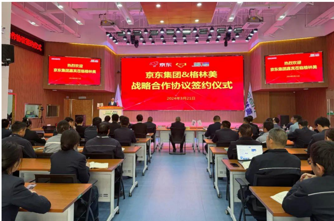
图 1 格林美与京东集团举行战略合作签约仪式

2024 年 3 月 19 日，公司控股子公司武汉动力电池再生技术有限公司与东风汽车集团股份有限公司全资子公司东风乘用车销售有限公司共同签署了《关于建设动力电池全生命周期绿色产业链的战略合作协议》，实现对废旧动力电池的回收、资源化、再制造的全生命周期价值链体系，良好把握国家《推动大规模设备更新和消费品以旧换新行动方案》的发展机遇。