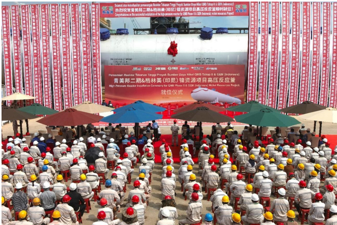
图 2 公司印尼镍资源核心设备高压浸出反应釜（1168 立方米）就位仪式

2024 年 2 月 21 日，格林美印尼镍资源项目建设百日冲刺誓师大会在荆门市格林美新材料有限公司与印尼青美邦新能源材料有限公司（以下简称“印尼青美邦”）同步举行，34 家合作伙伴参与百日冲刺誓师大会，共同誓言打赢公司印尼镍资源项目百日冲刺攻坚战，标志着公司印尼镍资源二期项目的建设正式进入百日冲刺阶段，将于 2024 年 6 月开始三个模块在年内分批竣工投产，并全部释放产能，另外公司与印尼 PT Merdeka Battery Materials Tbk（以下简称“MDK”）合资（MDK 控股）的 4.0 万吨金属镍/年产能也将在实现年内全部投产的目标。同时，公司在印尼建设的年产 3 万吨高镍三元前驱体产能将于今年 7 月竣工投产，将成为印尼首条三元前驱体生产线，按照“把红土镍矿投进去，把三元材料炼出来”的产业理想，在印尼打通由低品位红土镍矿到电池原料和电池材料的世界一流镍资源新能源材料全产业链与工程技术创新体系以及打造中国与印尼镍资源合作发展的亮点工程，提升公司在全球新能源材料制造领域的核心竞争力，打造公司在欧美两大新能源新兴市场进军的竞争力，符合公司发展战略和广大投资者利益。