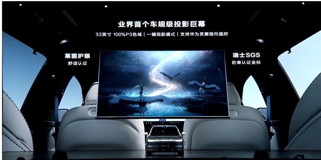
图 1：问界 M9 车规级投影巨幕

公司为问界 M9 提供的车载巨幕投影方案成功上车，满足车内影视播放、游戏娱乐、办公工作的需求，使乘车过程中的娱乐生活更加优质和舒适，重新定义车内智慧空间。随着车载显示屏成为智能汽车“人机交互”功能的核心器件，智慧大屏的应用必要性得到市场检验，并逐步完成消费者的市场教育。目前，问界 M9 已进入量产交付阶段，预计在项目生命周期内对公司经营业绩产生积极影响。