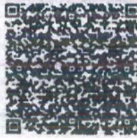
胡国仁年检二维码