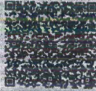
王伟青年检二维码

发证日期: 2003 年 02 月 19 日 Date of Issuance y m d