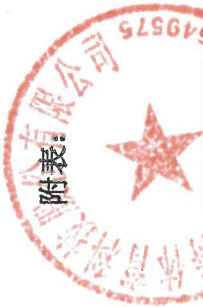
附表：2023 年度募集资金使用情况对照表（2022 年股票发行）