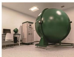
积分球测试实验室