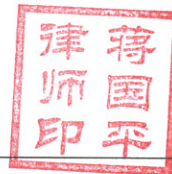
蒋国平 律 师