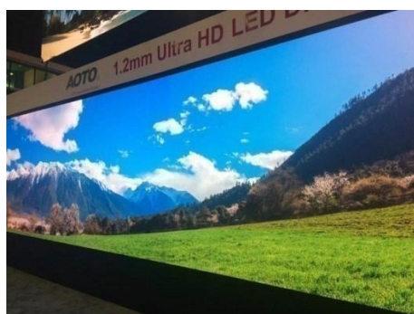
奥拓电子8K 24Bit高密度LED显示屏