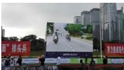
2015年深圳国际马拉松