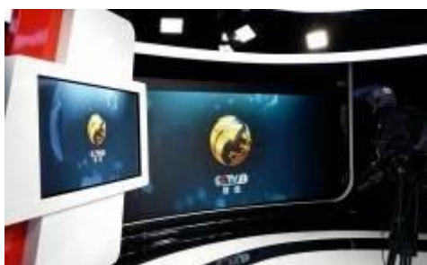
2015年央视财经频道新演播大厅项目

2015年以公司高密度8K 24bit超高清LED显示系统为代表的产品，亮相世界各大大专业展会，受到客户的好评。2015年，公司开发了一批新的客户，公司LED显示系统应用到央视财经频道（CCTV-2）新演播大厅和江苏电视台，为香港机场打造90度无缝拼接立柱广告屏，成功助力法兰克福车展。公司高密度LED显示产品在大交通（机场、地铁、码头和公交站台等）、电视台及广告传媒等领域的应用不断扩大。