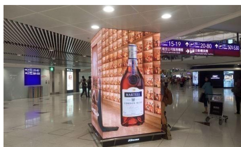
2015年香港国际机场四面“水晶柱”LED广告系统