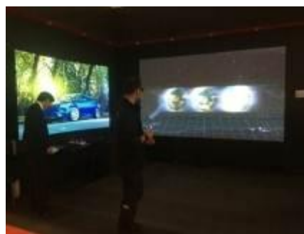
奥拓电子沉浸式3D显示技术展示