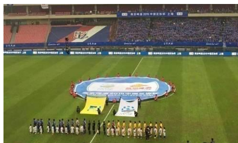
2015年中国足协杯决赛杯