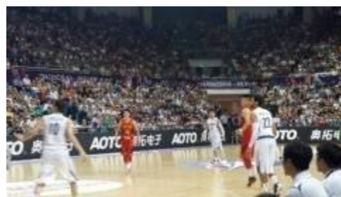
2015年FIBA（国际篮联）长沙亚锦赛