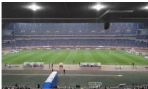
2016年中国足协超级杯（重庆）