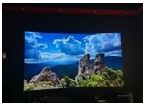
奥拓电子宽色域和HDR技术展示