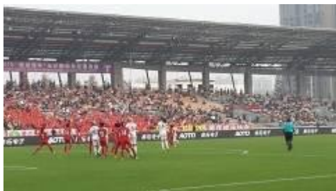
2015年国际女足邀请赛