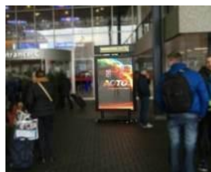
奥拓数字媒体行业LED显示系统终端

2015年，随着传统银行向智慧银行转型，公司为客户研制多款软件和硬件产品，如智能网点云台控制系统、智能网点厅堂PAD助销系统和智能网点体验互动及营销系统等。新研发的软件和硬件产品为公司开拓智慧银行业务提供了重要支撑。