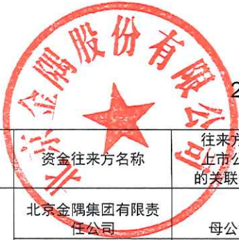
2016年度非经营性资金占用及其他关联资金往来情况汇总表