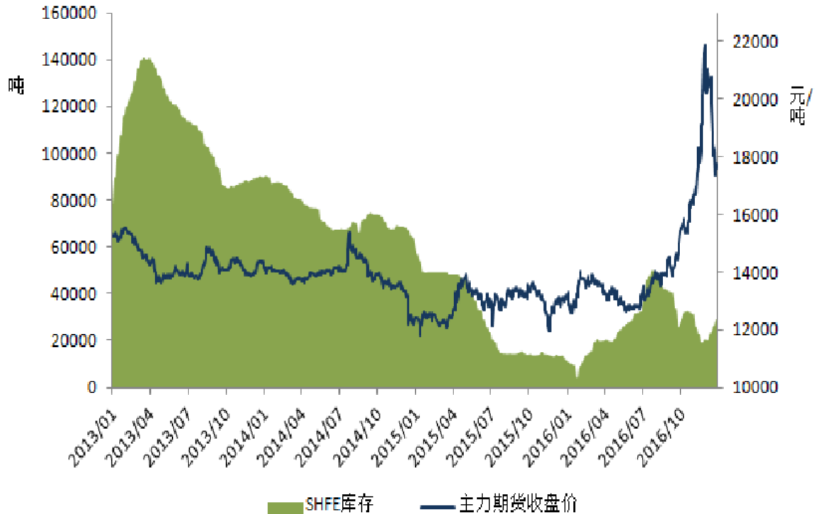
SHFE 铅库存和主力合约价格

2016年沪铅主力合约均价为14,664元/吨，同比上涨13.6%。2016年国内现货市场铅价均价为14,530元/吨，同比上涨11.0%。