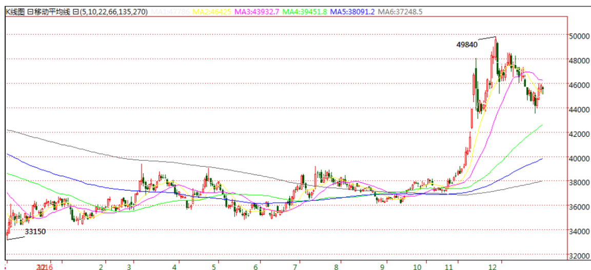
SHFE 三个月期铜日 K 线图

报告期内，公司继续探索转型升级，发展循环经济，现已成为全国再生铅行业中资质最齐全、最具竞争优势的企业之一。开创了再生铅与原生铅相结合的新模式，使铅工业步入了“生产—消费—再生”的循环发展之路，被誉为“再生铅发展的中国样本”。目前公司正在建设废铅酸蓄电池回收网络体系建设项目，本项目通过自建和合作等方式，整合现有废铅酸蓄电池回收网点，构建覆盖重点区域的点面结合的废铅酸蓄电池回收利用体系，能有效提升我国再生铅产业的资源保障能力，对再生铅产业的可持续发展至关重要。同时该项目可实现废铅酸蓄电池利用的高效化、生产过程的清洁化、废弃物处置的无害化，对于提高我国重金属污染防治水平，提高废铅酸蓄电池回收环节的产业集中度，规范回收秩序，将产生积极影响。