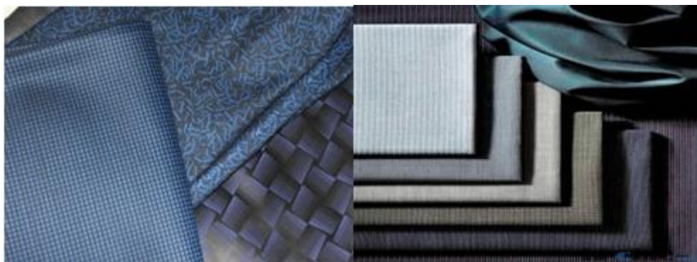
(4) 其它精纺呢绒：主要用于行业制服及团体制服。包括哔叽、凡立丁各类花呢等产品。