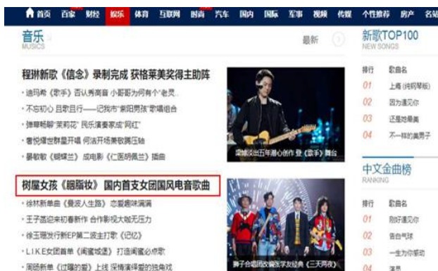
树屋女孩全新单曲《胭脂妆》迅速登陆百度首页

报告期内，公司旗下宋城娱乐打造的中国大型演艺女团“树屋女孩”紧紧围绕“新国风”定位，取得不俗的成绩。国内首支由女团演唱的“国风+电音”单曲《胭脂妆》上线数小时，评论量过万，同时收到网易独家推送及百度热搜推荐。女团成员不仅登上CCTV音乐频道春晚、获江苏卫视真人秀《芝麻开门》邀请参与节目，还受邀参与国际钢琴巨星郎朗宁波新年音乐会。公司立足传统文化、紧贴当下热点，形成线上线下多屏互动，打造演艺女团IP。