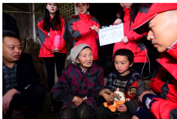
宋城六间房大篷车文化扶贫之旅启动，把爱意写满山川

报告期内，公司旗下宋城娱乐打造的中国大型演艺女团“树屋女孩”紧紧围绕“新国风”定位，取得不俗的成绩。国内首支由女团演唱的“国风+电音”单曲《胭脂妆》上线数小时，评论量过万，同时收到网易独家推送及百度热搜推荐。女团成员不仅登上CCTV音乐频道春晚、获江苏卫视真人秀《芝麻开门》邀请参与节目，还受邀参与国际钢琴巨星郎朗宁波新年音乐会。公司立足传统文化、紧贴当下热点，形成线上线下多屏互动，打造演艺女团IP。