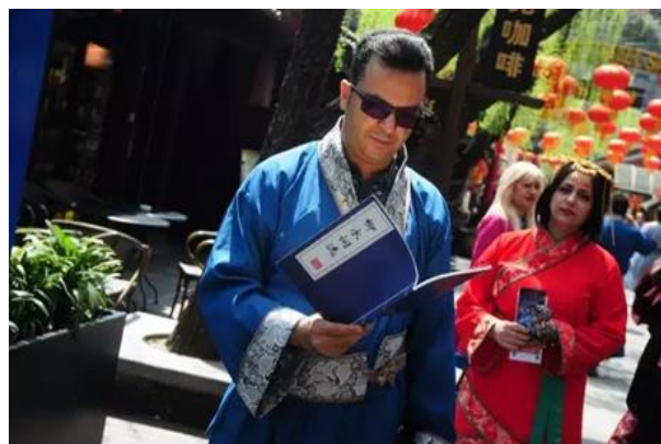
杭州宋城万人穿古装玩穿越，创世界纪录

游的是氛围、玩的是体验、忆的是细节、宣的是事件、盈的是商业。杭州宋城景区这次的“我回大宋”全民穿越活动，已经成为了一个具有全球品牌影响力的现象级活动，它让人们知道并且看到一个与当今时代完全不一样的地方，让他们不仅从身体上感受穿越，还能从思想上真正穿越到这样一个朝代。以杭州为试点取得成功后，这一模式还将异地复制到三亚、丽江、九寨等众多千古情景区，形成宋城全新的文化IP，开创主题公园发展的新模式。