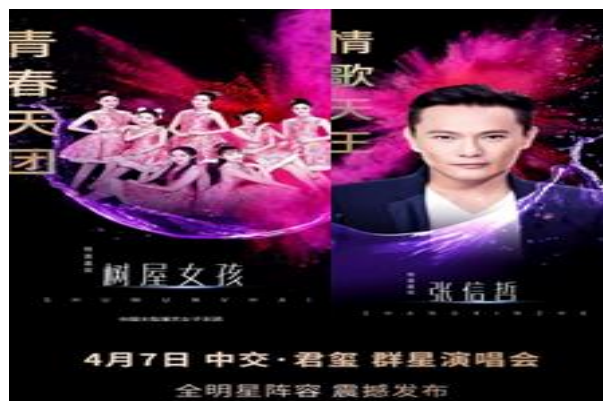
树屋女孩受邀宁波演唱会开场嘉宾

报告期内，公司旗下宋城科技推进与加拿大时光工厂的合作，预期首个科技互动项目将于6月在宋城景区推出；宋城科技与美国SPACES公司的合作项目进一步明确了方案，进入实质性的第二阶段工作内容，保障项目于2018年中旬推出。此外公司开行业之先河，着手探索机器人在娱乐场景的落地运用，包括符合主题公园场景的核心功能搭建与测试，并辅以定制舞台、主题服装等包装手段，将于近期推出。公司还在无人机、智慧客服、检票机器人、新一代中小型游乐设备等方面也进行深入挖掘，并进行新技术、新设备的筛选、引进与整合。