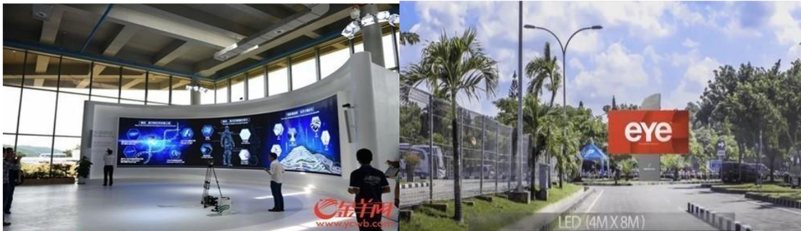
国家基因库的雷曼户内P3LED全彩屏体显示屏

业务开拓： 报告期内，公司加大LED业务的海内外市场开发力度和品牌建设力度，在加大与现有客户合作深度广度的基础上积极开发新客户，拓展新兴市场，加大海外市场LED产业布局，LED产品已遍布全球，从巴厘岛机场到英国街道，再到国家基因库、西安华南城，雷曼LED品牌无处不在。公司参加了荷兰ISE国际展览会、2016广州国际广告标识及LED展览会、墨西哥国际广告标识展，美国视听显示技术与设备展Infocomm2016等国内外展会，全方位展示了公司LED封装显示屏等高科技LED产品。公司LED封装销售工作日趋稳定，景观亮化市场保持持续增长；LED显示屏业务的国际市场拓展力度不断加强，新开发大客户的数量和质量有了明显提升，报告期内新增完成了迪拜、莫斯科、墨西哥城等地的外派驻点。LED照明业务方面，公司全资子公司拓享科技积极参加了美国国际LED照明展、德国法兰克福照明展、美国国际照明展、2016广州国际照明展（光亚展）、2016年香港秋季灯饰展等展会，不断加大海外照明市场的拓展，使得公司LED照明产品业务得到显著增强，进一步提升公司LED主业的综合竞争力。