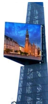
雷曼发明专利非对称直插器件的LED显示屏

生产管理： 公司非常重视产品质量的提升及生产制造人员管理。通过加强生产过程控制，强化供应商管理和价格管理，严格保证产品质量，增强公司的产能利用率 and 产品研发效率，为公司扩产增收夯实基础，报告期内公司打造了小点间距样板车间，增加了2000万销售额产出能力。同时大胆进行工艺革新，简化工艺流程，降低成本，提升生产效率，并导入简便实时的制程监控手段，有效防范人为差错。在人员方面，公司推动落实一人多能多岗培训，对骨干员工进行专项培养，保证了管