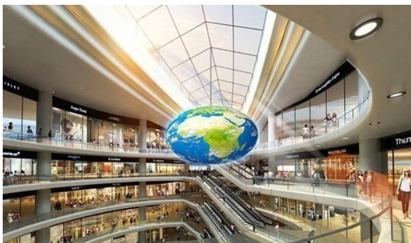
康硕展LED椭圆球形屏

技术研发： 报告期内，公司坚持自主创新，在注重产品质量的基础上持续加大研发投入力度，密切跟踪行业的技术发展方向与趋势，持续开展新产品、新工艺的研究开发工作，进一步满足市场对产品功能的需求。公司全资子公司拓享科技陆续开发出一些大功率类，具有市场竞争力的新品。控股子公司康硕展新推出LED椭圆球形屏，是康硕展又一创意曲面显示产品力作，该产品可全方位立体环绕展示画面，使观看者切身感受360度无死角视觉动态，具有独特创意外观及高科技专利技术。截至报告期末，公司及全资子公司共有已获授权和已获受理的专利253项，均系原始取得。报告期内，公司及全资子公司新增已获授权和已获受理的专利共45项，包含已获授权的专利31项，已获受理的专利14项，已获得专利权的专利中，发明专利9项，实用新型专利22项，相关专利进一步提高了公司的LED产品工艺，有效降低生产成本并实现产品的绿色、环保、节能，为公司LED主业的快速发展提供了有力的技术支撑。