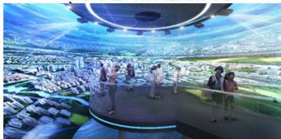
上虞e游小镇3号楼1-2层旅游接待大厅