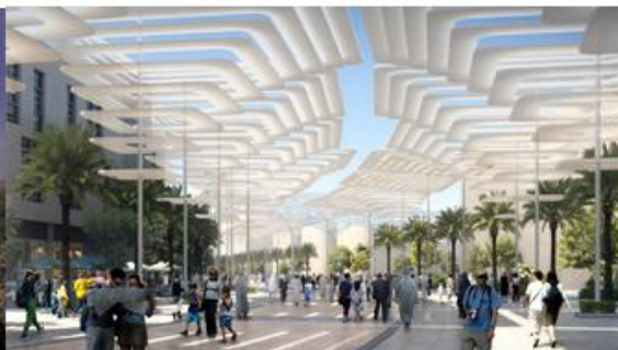
迪拜世博会展览馆效果图