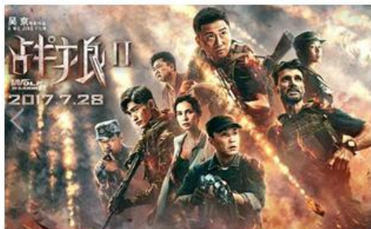
影视特效渲染《战狼2》

公司对CG技术持续进行着探索与实践，努力开拓更广泛的运用领域，包括新型虚拟/增强/混合现实技术、视觉识别捕获交互、交互沉浸系统等，将视觉运用拓展至文化娱乐、医疗卫生、教育科研等多产业及众多新领域。其他CG视觉服务相关产品和服务图示如下：