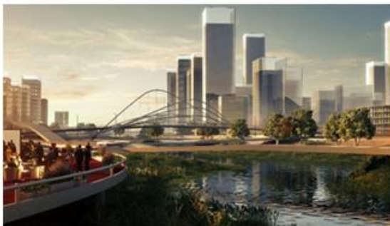
招商前海湾设计效果图