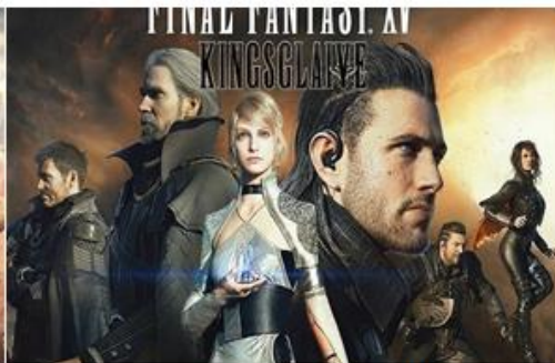
三维动画渲染《最终幻想15》