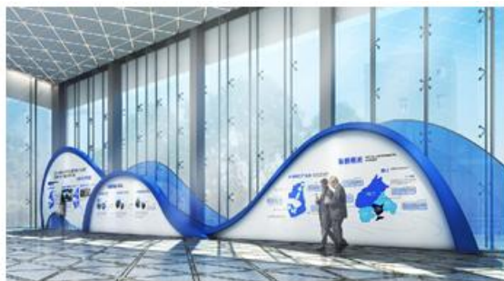
珠海（阳江）合作共建园展示中心

公司CG视觉场景综合服务，是围绕核心创意内容，以CG技术为主要表现手段，通过合理设计规划，结合多种空间构筑形式和多媒体辅助手段，共同构建出具备高度艺术化、个性化、体验感和互动感的特定展示场景；具体可以结合成像技术，互动触摸、体感技术、虚拟/增强/混合现实等互动内容，搭配各类多媒体内容及表演、舞台机械等多种演绎形式并辅以场景构建。主要产品形式为各类展厅、展馆、展览、发布会、主题活动等。该类业务的主要客户和典型需求主要如各类产业园区展、城市规划展、房地产企业展、产品发布会、企业文化宣传展、主题活动以及博物馆、展览馆的数字化布展等。CG视觉场景综合服务相关产品和服务图示如下：