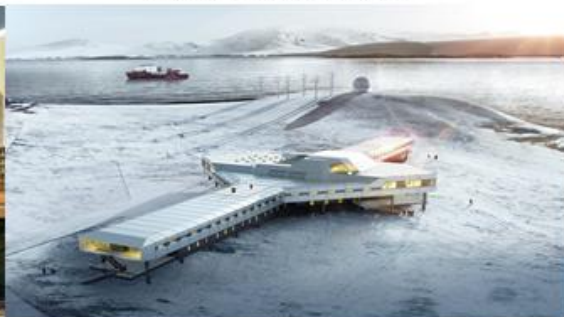
中国第五个南极考察站效果图