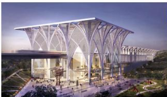
新加坡-吉隆坡跨国轻轨铁路系统效果图

公司CG静态视觉服务是利用CG技术，通过计算机软件模拟，将设计人员的创意和构思展现为数码化的静态图像。该服务主要产品形式为各类视觉效果图像，主要客户为建筑设计、规划设计、工业设计等行业。作为产业链中专业化分工的一个重要环节，公司通过专业技术和专注服务，帮助各行业呈现理想的虚拟效果。CG静态视觉服务相关产品与服务图示如下：