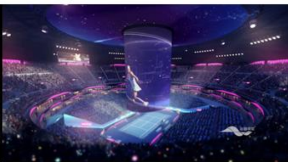
深圳国际女子职业网联年终总决赛申办片