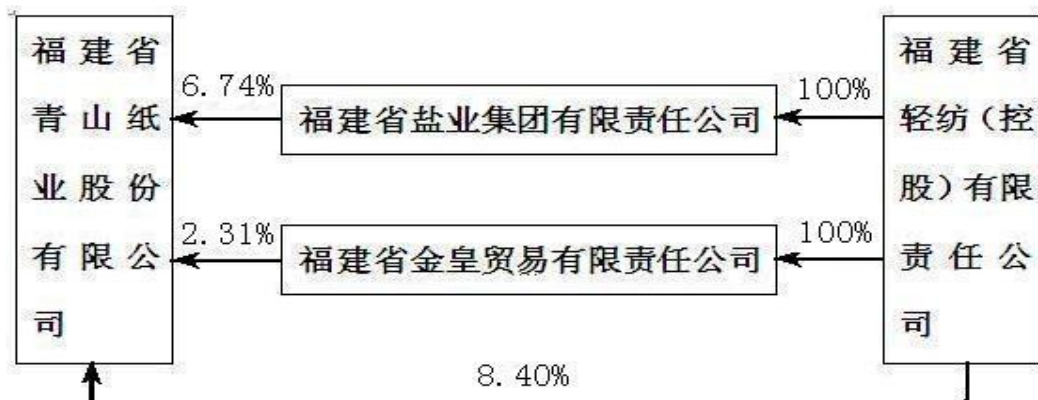
公司与控股股东之间的产权及控制关系的方框图