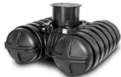
污水处理产品 -- 按需配置