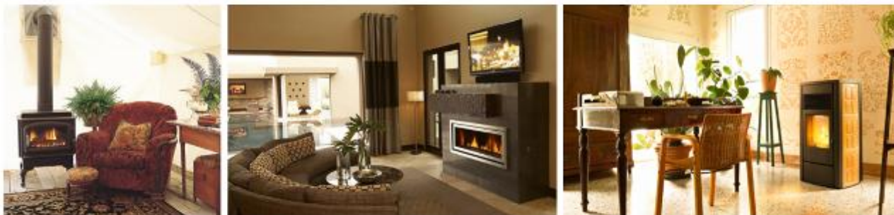
秸秆颗粒真火壁炉

各种款式真火壁炉类产品，不仅提供居家舒适采暖，也在家居装饰中起着画龙点睛的效果，让居家其乐融融。