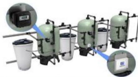
MVS方案 -- 解决复杂多样化处理难题