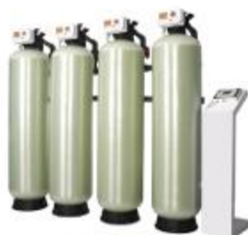
MTS方案 -- 解决大水量难题