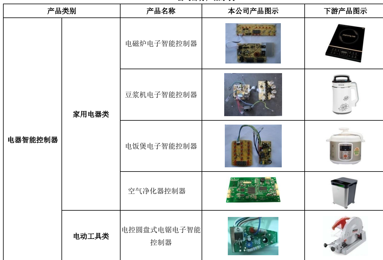
公司部分产品示例

公司的电子智能控制器产品主要包括两大类：电器智能控制器、智能电源及控制器。公司部分产品实例如下：