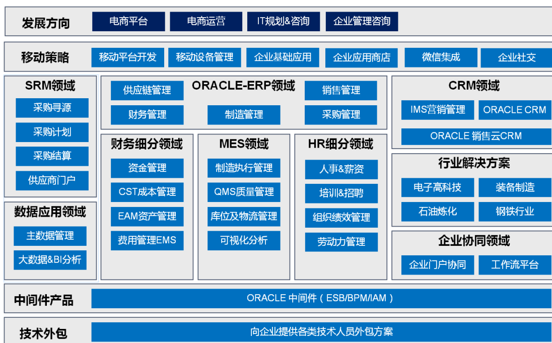
赛意信息产品及服务图示

具体而言，公司面向企业级客户提供的产品及服务按照应用领域细分如下：（1）企业资源计划（ERP）领域：财务管理、生产管理、销售管理、采购管理、人力资源管理及劳动力管理、仓储管理；（2）客户关系管理（CRM）领域：市场营销管理、销售过程管理、服务管理、渠道及合作伙伴管理；（3）供应商关系管理（SRM）领域：采购计划、采购寻源、采购合同、采购结算支付、供应商门户；（4）商务智能（BI）领域：面向企业客户各业务领域及外部市场的结构化与非结构化数据的采集及分析；（5）制造执行系统（MES）领域：基于智能制造的制造执行系统（MES）及其实施开发服务，服务涵盖车间生产活动管理、车间数据采集管理、品质管理、仓储物流管理、追溯管理、设备管理等；（6）移动应用领域：企业移动应用平台及其实施开发服务。