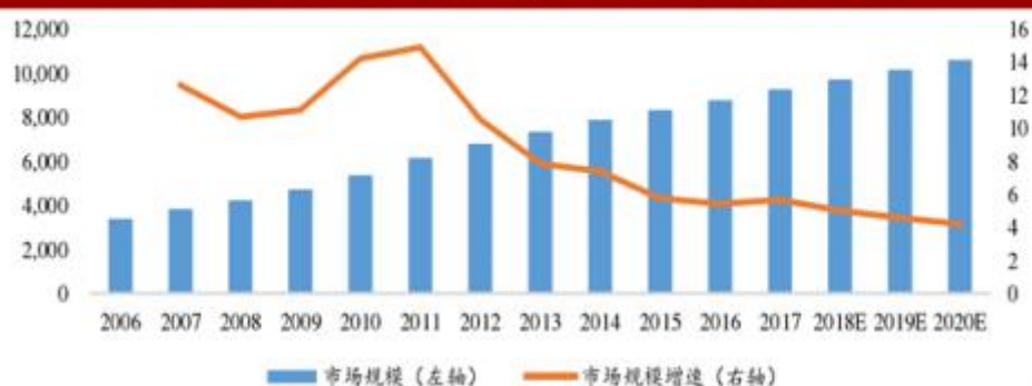
图表：女装行业市场规模（亿元）及增速（%）