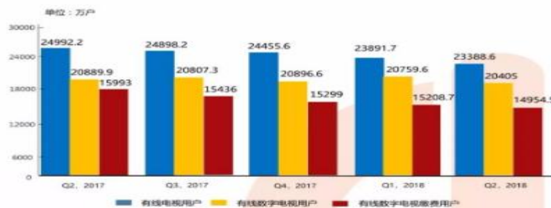
图表 6 Q2,2017-Q2,2018 中国有线电视用户发展情况