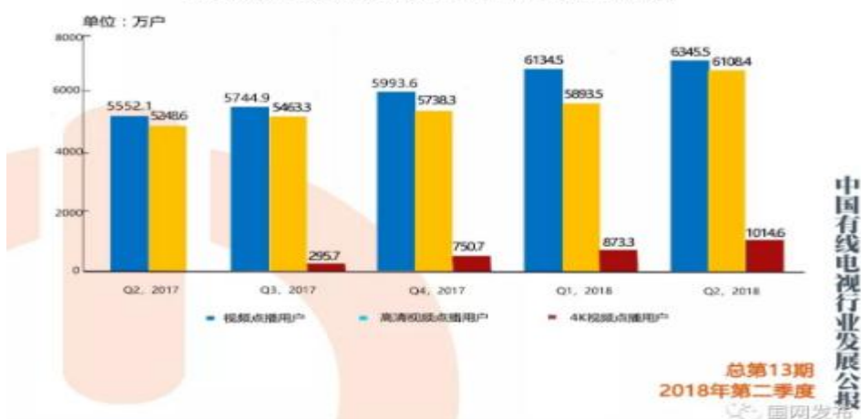
图表 7 Q2,2017-Q2,2018 视频点播、高清点播、4K点播用户情况

截至2018年6月底，我国有线视频点播用户总量达6345.5万户。其中，高清视频点播用户平稳增长，季度净增214.9万户，环比增长3.65%，总量达到6108.4万户；4K视频点播用户快速增长，季度净增141.3万户，环比增长16.18%，总量达到1014.6万户。