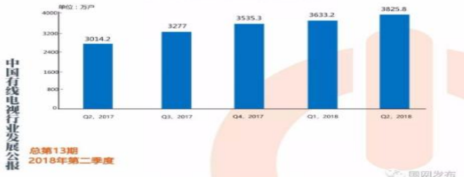
图表 8 Q2,2017-Q2,2018 有线宽带业务发展

2018年第二季度，我国有线宽带用户持续平稳增长。有线宽带用户季度净增192.6万户，环比增长5.30%，总量达到3825.8万户。宽带业务渗透率进一步提升至16.36%。