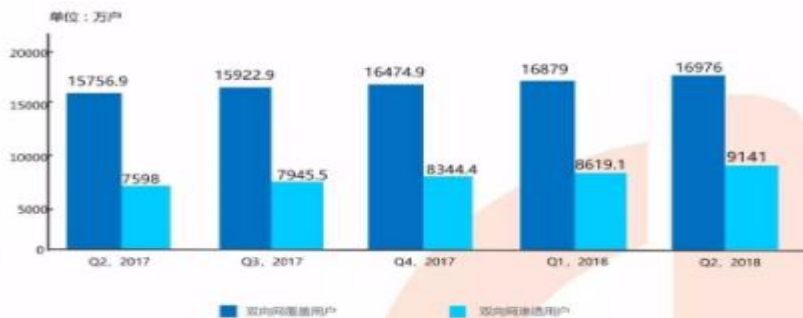
图表 10 Q2,2017-Q2,2018 有线双向网络用户发展

2018年二季度，我国有线双向网络改造工作平稳推进，其中，随着双向网络建设的逐步深入，双向网络覆盖用户增速有所放缓，但是双向业务的使用率提升显著。截止到2018年6月底，有线双向网络覆盖用户季度净增97万户，环比增长0.6%，总量达到16976万户；有线双向网络渗透用户季度净增521.9万户，环比增长6.06%，总量达到9141万户，有线双向网络渗透率达到39.08%。