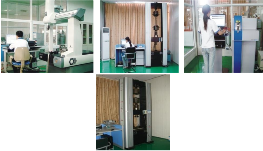
智能组合电器技术实验室