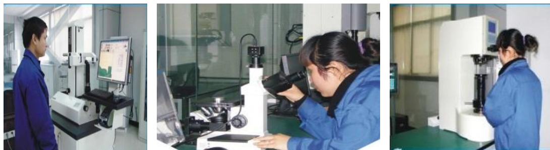
1100kV及1120kV特高压交直流隔离开关/接地开关技术实验室

集团现有技术中心大楼建筑面积 4200 平方米，其中设计、研发办公场地为 2000 平方米，试验场地为 2200 平方米，拥有样机试制加工设备共计 75 台套，满足各种功率的电机、变频控制装置的试制加工、试验。技术中心在研究开发方面具有完善的研发条件和先进的试验基础设施，已搭建如下 5 个主要的技术研发实验室，并配套了相应的检测设施（HV-1000 显微硬度机、PCI \mu\Omega /3 回路电阻检测仪、LF-ID 六氟化硫气体检漏仪、DWS-HC 微量水分测量仪、VIO210 对刀仪等）。