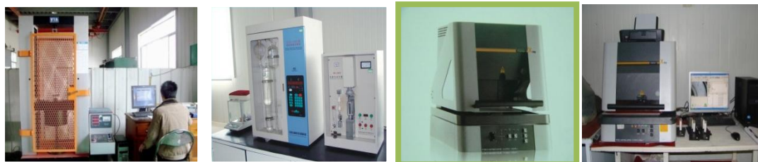
超高压交直流隔离开关/接地开关技术实验室