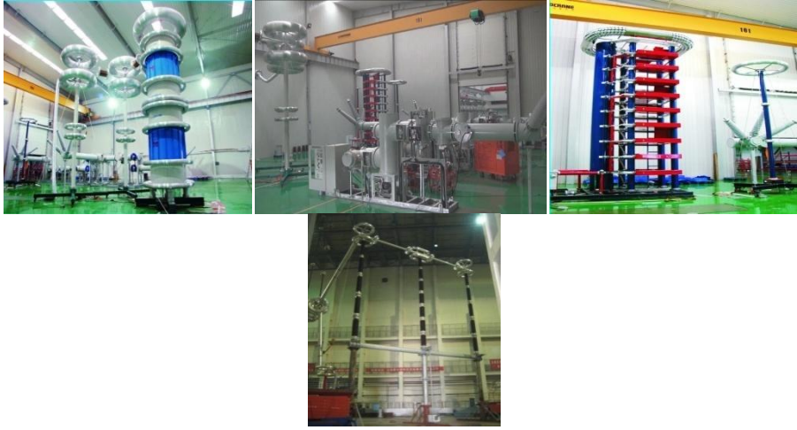
高压交流断路器技术实验室