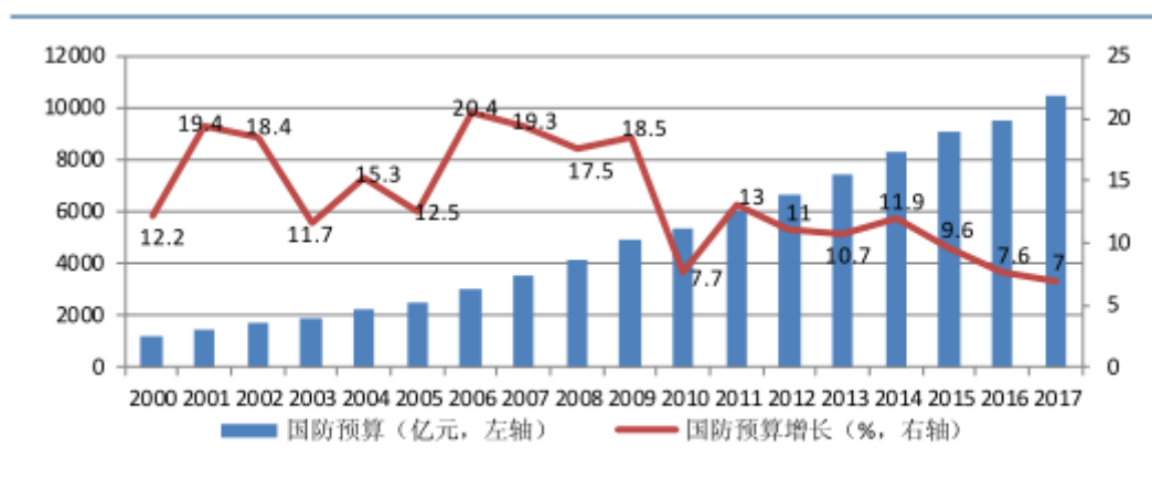
2000 年-2017 年中国国防预算

2014 年我国国防预算 8,082 亿元，同比增长 12.2%，2001-2014 年的复合增速 13.1%。2015 年国防预算达到 8,868.98 亿元，同比增长 10.1%，2016 年国防预算达到 9,543.54 亿元，比 2015 年增长了 7.6%。2017 年中国财政拟安排国防支出 10,225.81 亿元，比上年执行数增长 7%，2018 年国防支出预算 11,069.51 亿元，同比增长 8%，我国国防预算总额远低于美国 2015 国防预算 5,850 亿美元；我国人均国防支出仅 100 美元左右，远远低于美国的 1,820 美元；同时我国军费占政府支出、GDP 比重均较低，所以未来我国国防预算将依然保持在一个较高的增长水平。