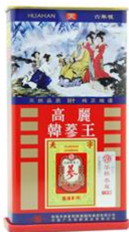
华韩药业红参产品