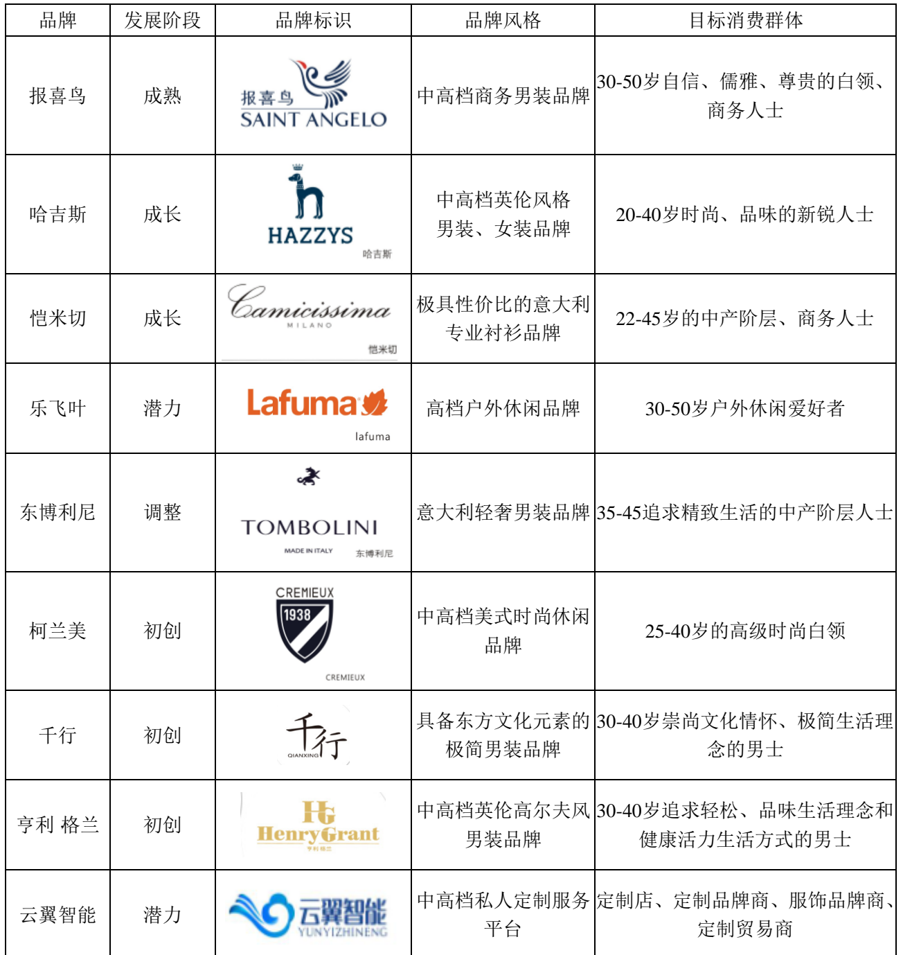
表 2 公司各品牌情况

报告期内，公司主要从事品牌服装的研发、生产和销售，产品品类涵盖西服、西裤、衬衫、夹克、羊毛衫、休闲裤等全品类男士服饰，运营品牌包含报喜鸟、HAZZYS（哈吉斯）、恺米切、lafuma（乐飞叶）、东博利尼、云翼智能、宝鸟等，产品能满足中产阶层不同场合下的着装需求。各品牌情况如下：