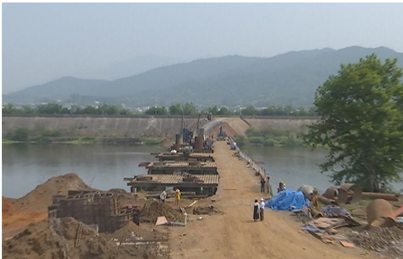
（图片说明：建设中的南山大桥）