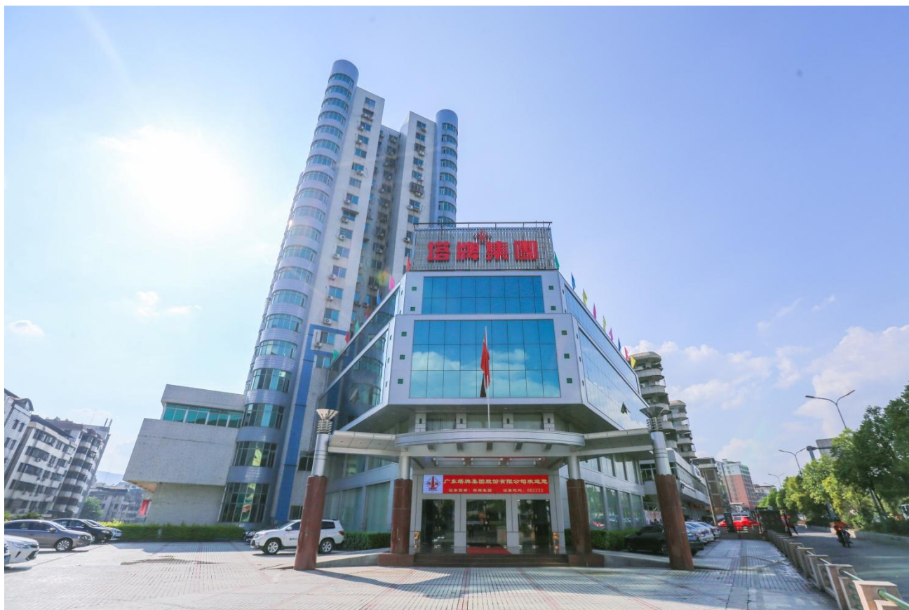
（塔牌集团办公大楼）

广东塔牌集团股份有限公司（下称：“公司”或“塔牌集团”），是一家以水泥为主业的民营集团公司，总部位于广东省梅州市蕉岭县，于 2008 年 5 月 16 日成功登陆深圳证券交易所中小企业板，证券代码：002233，证券简称：塔牌集团。