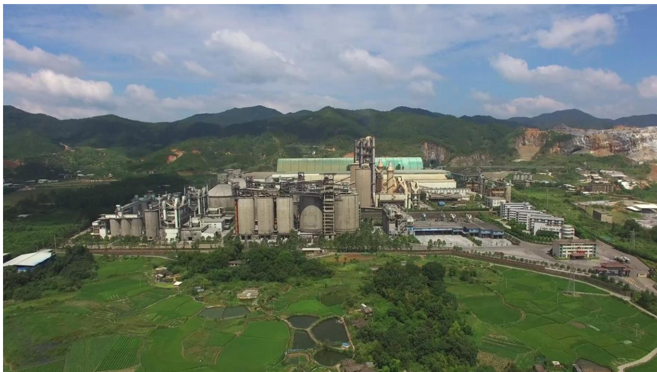
（图片说明：被评为绿色工厂的福建塔牌水泥有限公司）

公司根据《工业绿色发展规划》（2016-2020）及《绿色制造工程实施指南》的文件精神，制定了创建绿色生态水泥工厂行动计划，积极推动绿色工厂申报及认定工作。福建塔牌水泥有限公司根据文件精神及标准要求，积极开展绿色工厂对标建设工作，经自评价、第三方评价机构现场核定评价、省级工业和信息化主管部门评估确认及专家论证、公示等环节，2018年11月份福建塔牌水泥有限公司被国家工信部列入为第三批绿色工厂示范企业（绿色工厂）。