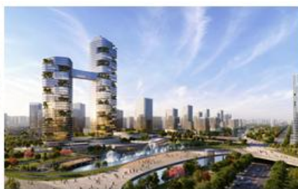
长沙高铁西城片区城市设计效果图