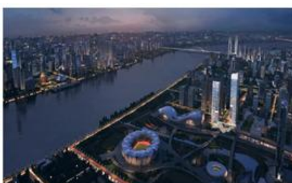
万象世界中心宣传片