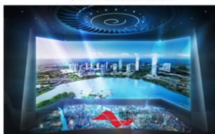
郑州航空港城市会客厅