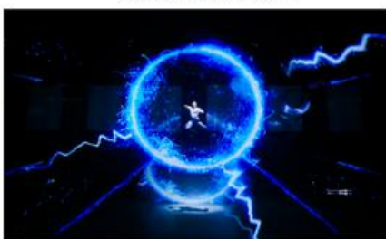
上汽科创嘉年华舞台秀《明日之城》