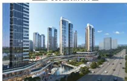
珠海横琴科学城一期效果图