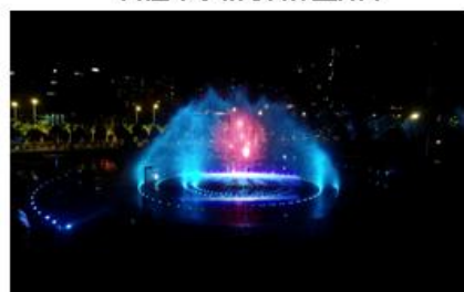
海南海航日月广场音乐喷泉水舞秀《鲲鹏传奇》