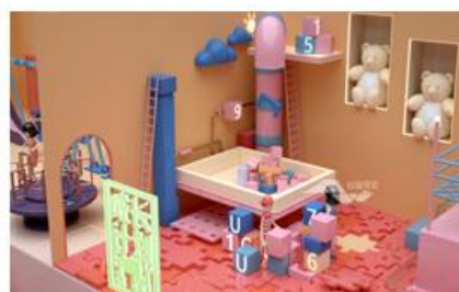
松江印象城综合体宣传片

公司CG动态视觉服务是利用CG技术，将创意方构想展现为数字化的视频或多媒体作品，实现动态视觉效果并提供相配套的辅助功能；主要产品形式为动画影片、宣传片、特效和各类CG多媒体内容。目前，公司该类业务主要客户为房地产行业客户、各类商业客户和政府类机构，通过运用动画影片等形式，帮助各行业客户更好地展示其产品、服务，实现展示及营销目的。CG动态视觉服务相关产品与服务图示如下：