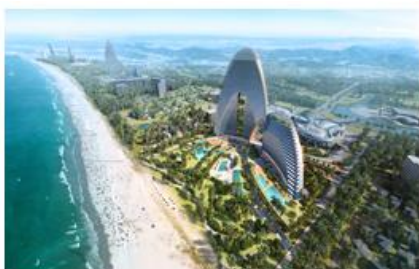
三亚国际免税城效果图

公司CG静态视觉服务是利用CG技术，通过计算机软件模拟，将设计人员的创意和构思展现为数码化的三维静态图像。该服务主要产品形式为各类视觉效果图像，主要客户为建筑设计、规划设计、工业设计等行业。作为产业链中专业化分工的一个重要环节，公司通过专业技术和专注服务，帮助各行业呈现理想的虚拟效果。CG静态视觉服务相关产品与服务图示如下：