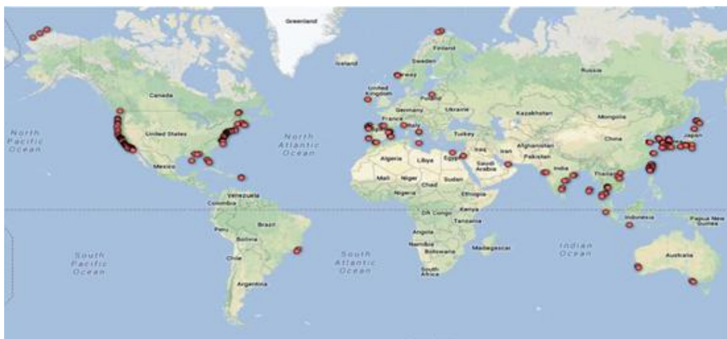
图五 全球超视距雷达部署图

利用地波超视距雷达作为主要手段的海洋探测已在世界各国成功开展，欧美发达国家已发展出了成熟的商业化的地波雷达网络，如CODAR、WERA和OSMAR系统。如美国东西海岸共部署SeaSonde地波超视距雷达140余部。