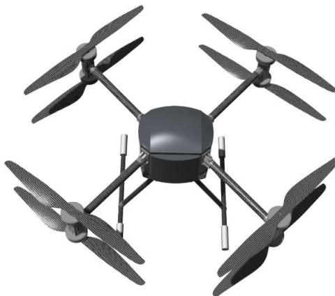
图四 小型抗电子干扰无人机

报告期内，华清瑞达完成了汽车雷达回波模拟器的研制工作，并已交付客户应用于其汽车雷达的研制及生产。报告期内，华清瑞达对汽车雷达仿真及测试市场进行了调研和讨论，形成以下结论：