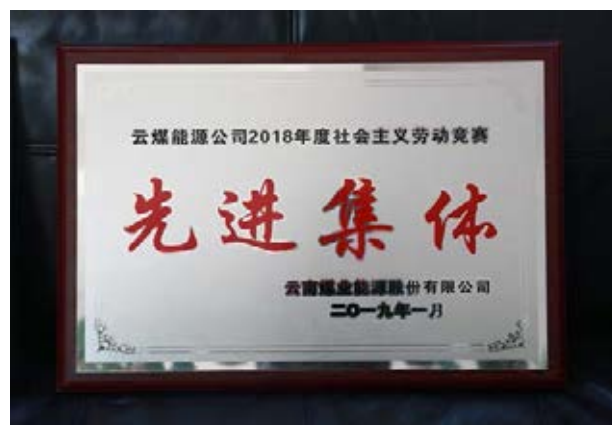
云煤能源公司 2018 年度社会主义 劳动竞赛先进集体