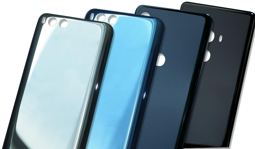
图为手机陶瓷后盖，源自公司内部资料

2018年，在市场需求以及国家政策大力推动下，5G建设及商用化进一步加速。5G技术商业应用极其广泛，从娱乐到物联网，再到云服务行业，5G的建设拉动产业链的需求增长。受益于5G建设，光通信市场持续保持平稳增长，公司相关产品销售规模继续得以提升。报告期内，公司不断提升手机陶瓷后盖产品的工艺技术，并召开了“三环火凤凰2.0发布会”，推出了主打新颜色、新工艺、新效果的迭代升级版“三环火凤凰2.0”陶瓷材料，在同等级结构下，“火凤凰2.0”陶瓷的重量比以前可减轻30%左右，在工艺效果及颜色方面都取得了新的突破，为客户提供更多样化的产品设计方案。