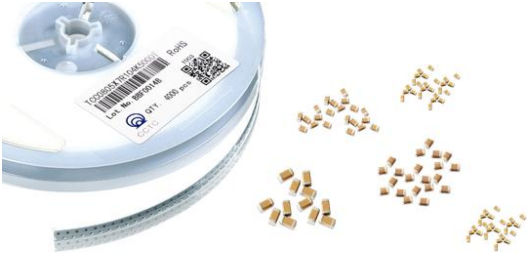
图为多层陶瓷片式电容器（MLCC），源自公司网站

随着片式电容应用领域的拓宽以及国外产能的逐步转移，MLCC产品需求强劲。公司把握时机，积极推进新规格产品研发以及提升原有产品质量，凭借自身技术优势和品牌效应，进一步引入新客户，扩大销售规模，目前公司的MLCC产品已广泛应用于家电、照明、消费电子、工业控制、通信设备、汽车电子等领域。报告期内，该产品为公司利润的增长做出了较大贡献。