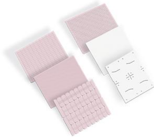
图为片式电阻用陶瓷基片