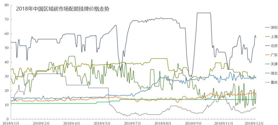
图 1 2018 年中国区域碳市场配额挂牌成交价格走势

2018 年，中国区域碳市场配额挂牌成交约 6,700 万吨，其中配额挂牌成交量约 3,200 万吨，配额协议成交量约 3,500 万吨。截至 2018 年 12 月 28 日，中国区域碳市场配额累计成交约 2.82 亿吨。价格方面，区域碳市场间价格存在差异性，以 2018 年 12 月 28 日收盘价为例，7 个区域碳市场价格区间为 8~57 元/吨（详见图 1）。综合价格指数趋势较为平稳，市场整体波动性较低。成交量方面，2018 年区域碳市场成交主要集中在 5~8 月，呈现一定的周期性（详见图 2）。