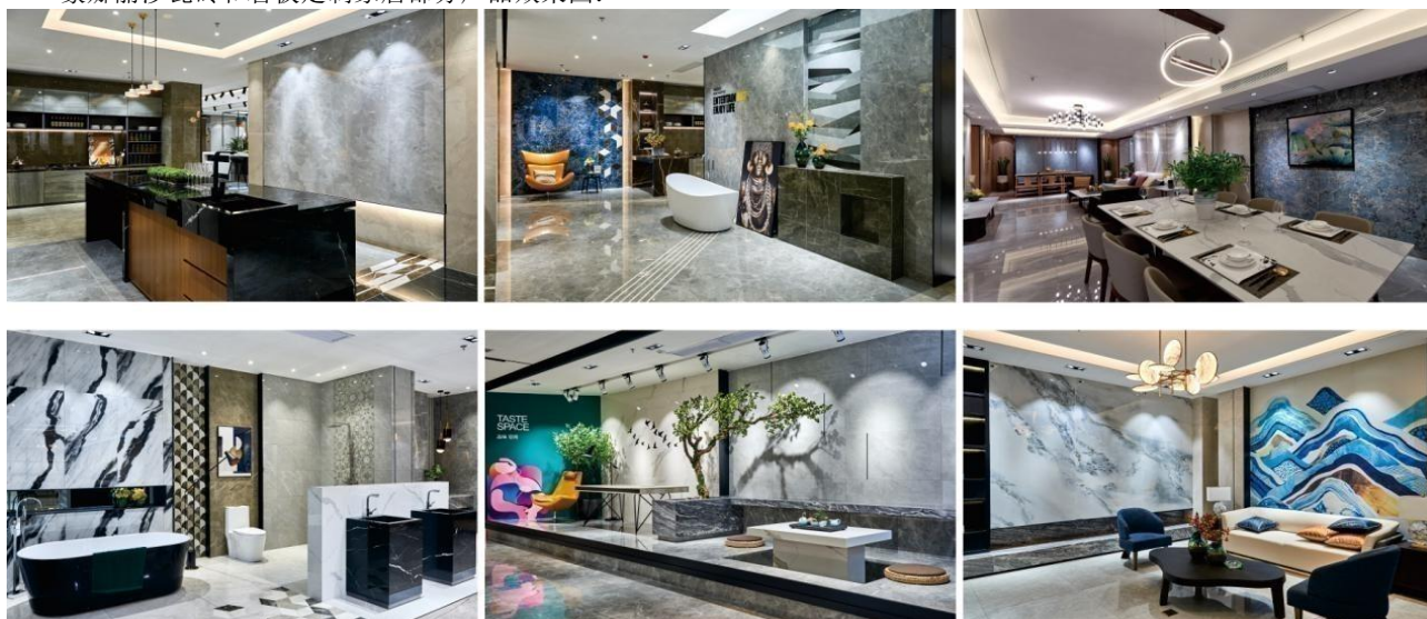
蒙娜丽莎瓷砖和岩板定制家居部分产品效果图：