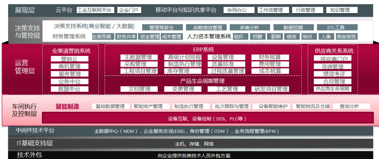
赛意信息360°信息化服务全景图

公司成立于2005年，是一家企业级信息化及智能制造综合解决方案服务提供商，专注于面向制造、零售、服务等行业领域的集团及大中型客户提供完整的信息化及智能制造解决方案产品及相关实施服务。公司的服务领域自大型核心ERP解决方案，逐渐横向向企业供应链上下端的供应商关系管理及全渠道营销管理领域解决方案延伸；并通过与国外厂商开展合作及自主研发产品双路径发展，自业务运营层解决方案垂直发展下沉至生产执行层解决方案，提供自研发仿真设计-车间制造执行-设备互联-智能仓储及物流管理一体化的智能制造领域解决方案。