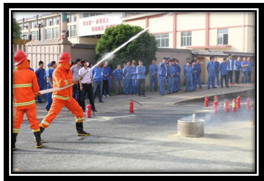
消防安全培训和消防比武