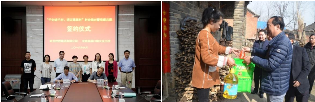
“千企结千村、消灭薄弱村”签约仪式

3) 对口扶贫，助力发展：签订“千企结千村、消灭薄弱村”村企结对协议书，本着自主自愿、合作共赢的原则，以项目合作为主要方式，积极开展结对共建，推动对接村实现集体经营性收入 2019 年底达到 5 万元以上、到 2020 年基本达到 10 万元以上的目标，并建立起符合市场经济要求的集体经济运行新机制，全面提升发展水平。