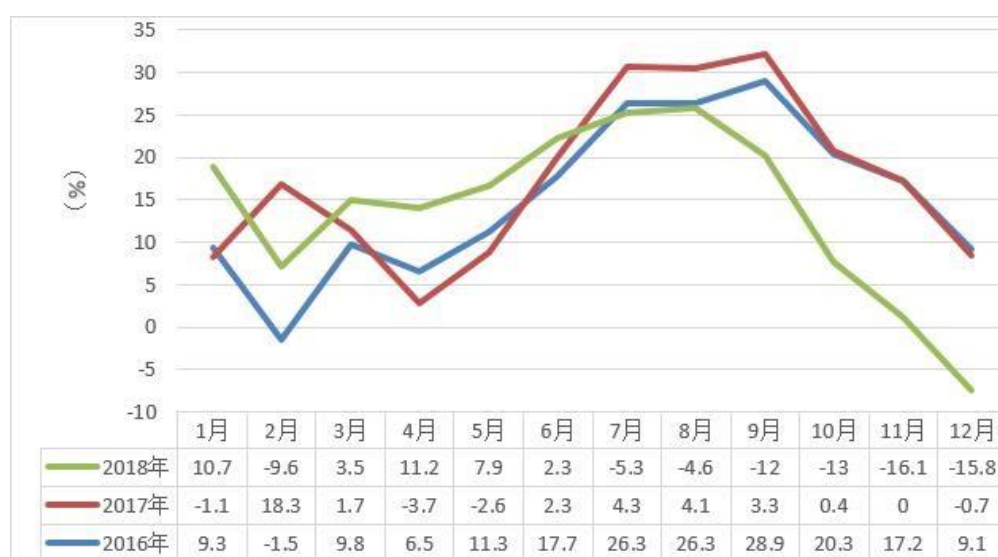
乘用车月度销售增长率（%）

对于公司车身零部件产品主要配套的乘用车市场，2018 年我国乘用车产销分别完成 2352.9 万辆和 2371 万辆，同比分别下降 5.2%和 4.1%。