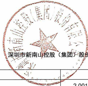
深圳市新南山控股（集团）股份有限公司 2018 年通过中开财务有限公司的存贷款等金融业务汇总表